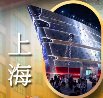
เรือเดอะทูลายส์