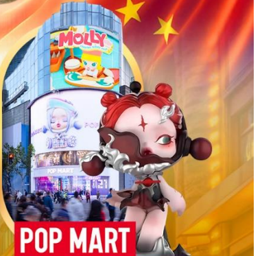
ช้อปปิ้งร้าน Pop Mart