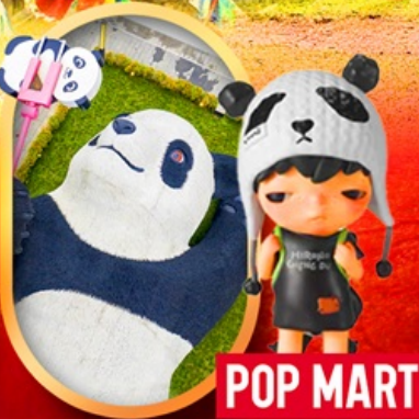
หมีแพนด้าเซลฟี POP MART