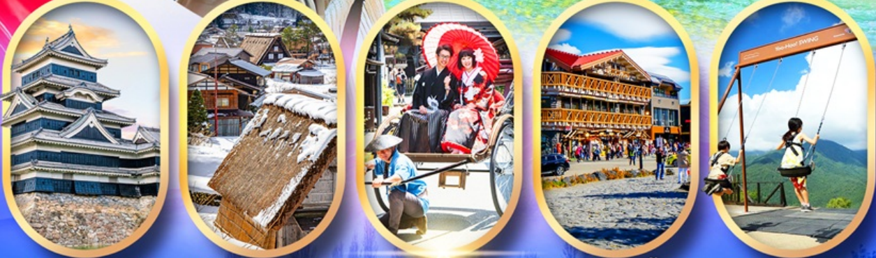
ปราสาทมัตสึโมโตะ หมู่บ้านชิราคาวาโกะ เมืองเก่าทาคายาม่า ภูเขาไฟฟูจิ ชั้น 5 ฮาคูบะ อิวาตาคะ