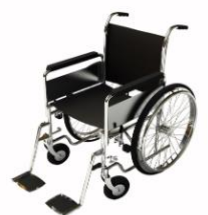
การรับบริการดูแลเป็นพิเศษ

กรณีผู้เดินทางต้องการความช่วยเหลือเป็นพิเศษ อาทิเช่น การใช้วีลแชร์ กรุณาแจ้งบริษัทฯ อย่างน้อย 7 วันก่อนการเดินทาง มิฉะนั้นบริษัทฯ จะไม่สามารถจัดการล่วงหน้าได้ เนื่องจากการขอใช้วีลแชร์ในสนามบินนั้น ต้องมีขั้นตอนในการขอล่วงหน้า และบางสายการบินอาจมีการเรียกเก็บค่าใช้จ่ายทั้งทางสนามบินในไทยและในต่างประเทศ ซึ่งผู้เดินทางสามารถสอบถามกับเจ้าหน้าที่ได้โดยตรงก่อนทำการจอง และหากในขณะของท่านมีผู้ต้องการดูแลพิเศษ เช่น ผู้ที่นั่งรถเข็น (Wheelchair), เด็ก, ผู้สูงอายุและผู้ที่มีโรคประจำตัวหรือไม่สะดวกในการเดินทางท่องเที่ยวในระยะเวลาเกินกว่า 4 - 5 ชั่วโมงติดต่อกัน ท่านและครอบครัวต้องให้การดูแลสมาชิกภายในครอบครัวของท่านเอง เนื่องจากการเดินทางเป็นหมู่คณะ หัวหน้าทัวร์มีความจำเป็นต้องดูแลคณะทัวร์ทั้งหมด