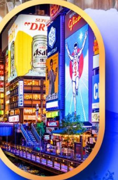
ย่านชินโจบุชิ