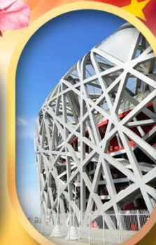
ผ่านชมสนามกีฬาฟาริงก