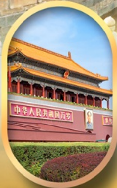
จัสมตริสเทียนอันเหมิน