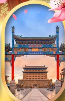
ถนนคนเดินเฮียนเหมิน