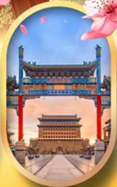
ถนนคนเดินเทียนเหมิน