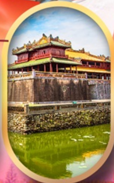
พระราชวังไคโน้ย