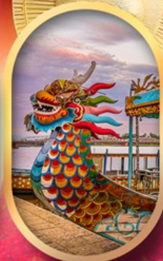
ล่องเรือมังกรแม่น้ำหอม