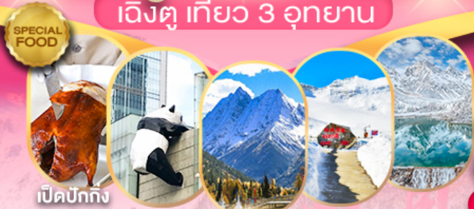
เปิดปิกนิก