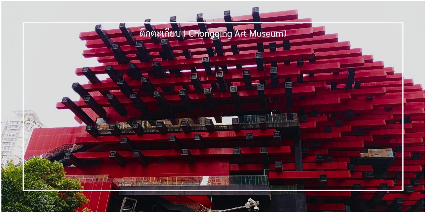
ตึกตะเกียบ ( Chongqing Art Museum)

นำท่านเช็กอินคาเฟ่ QiShuo Café&Tea คาเฟ่ที่ได้รับความนิยมอย่างมากในฉงชิ่ง ไฮไลท์คือวิวเมืองที่สวยงาม บรรยากาศดี ตั้งอยู่ใกล้หงหยาดัง โดดเด่นด้วยวิวเมืองและวิวแม่น้ำ เหมาะสำหรับการนั่งพักผ่อน ถ่ายรูปเช็คอิน ชมไฟหงหยาดัง จากนั้นนำท่านสู่ ถนนเก๋าริมแม่น้ำ เมืองโบราณหลงเหมินฮ่าว (Longmenhao Old Street) อีกหนึ่งแลนด์มาร์กสำคัญของเมืองฉงชิ่ง ตั้งอยู่ในเขตหนานอัน ริมฝั่งแม่น้ำแยงซี โดยถนนสายนี้เคยเป็นย่านการค้าและศูนย์กลางเศรษฐกิจที่รุ่งเรืองในยุคราชวงศ์หมิงและชิง ปัจจุบันได้รับการอนุรักษ์ไว้อย่างดี เพื่อเป็นแหล่งเรียนรู้ทางประวัติศาสตร์ และแหล่งท่องเที่ยวเชิงวัฒนธรรมที่เต็มไปด้วยเสน่ห์ บรรยากาศของถนนยังคงอบอวลไปด้วยกลิ่นอายวันวาน อาคารบ้านเรือนแบบโบราณผสมผสานกับร้านค้า ร้านกาแฟ และแกลเลอรีร่วมสมัยอย่างลงตัว อีกทั้งยังเป็นจุดชมวิวแม่น้ำที่โดดเด่น สามารถมองเห็นสะพานข้ามแม่น้ำแยงซีและทัศนียภาพของเมืองฉงชิ่งในมุมที่สวยงาม สร้างบรรยากาศโรแมนติกอย่างน่าประทับใจ