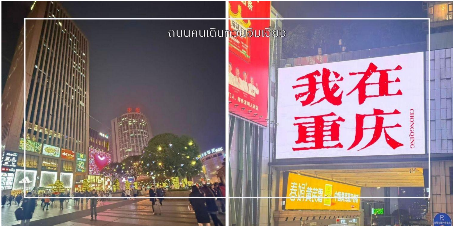
ถนนคนเดินกวนอิมเฉียว

นำท่านสู่ ถนนคนเดินกวนอิมเฉียว ย่านช้อปปิ้งและไลฟ์สไตล์ชื่อดังใจกลางเมืองฉงชิ่ง ตั้งอยู่ในเขตเจียงเป่ย์ เป็นแหล่งรวมความทันสมัยที่คึกคักตลอด 24 ชั่วโมง ภายในพื้นที่เต็มไปด้วยห้างสรรพสินค้า ร้านค้าแบรนด์ชั้นนำ ร้านอาหารท้องถิ่นและนานาชาติ รวมถึงคาเฟ่และแหล่งบันเทิงมากมาย เหมาะสำหรับการเดินเล่น ช้อปปิ้ง และสัมผัสบรรยากาศเมืองใหญ่ของฉงชิ่งอย่างแท้จริง อีกหนึ่งไฮไลท์สำคัญคือจุดถ่ายภาพยอดนิยม ป้ายไฟ 我在重庆 (I am in Chongqing) ซึ่งถือเป็นแลนด์มาร์กเช็คอินที่นักท่องเที่ยวไม่ควรพลาด