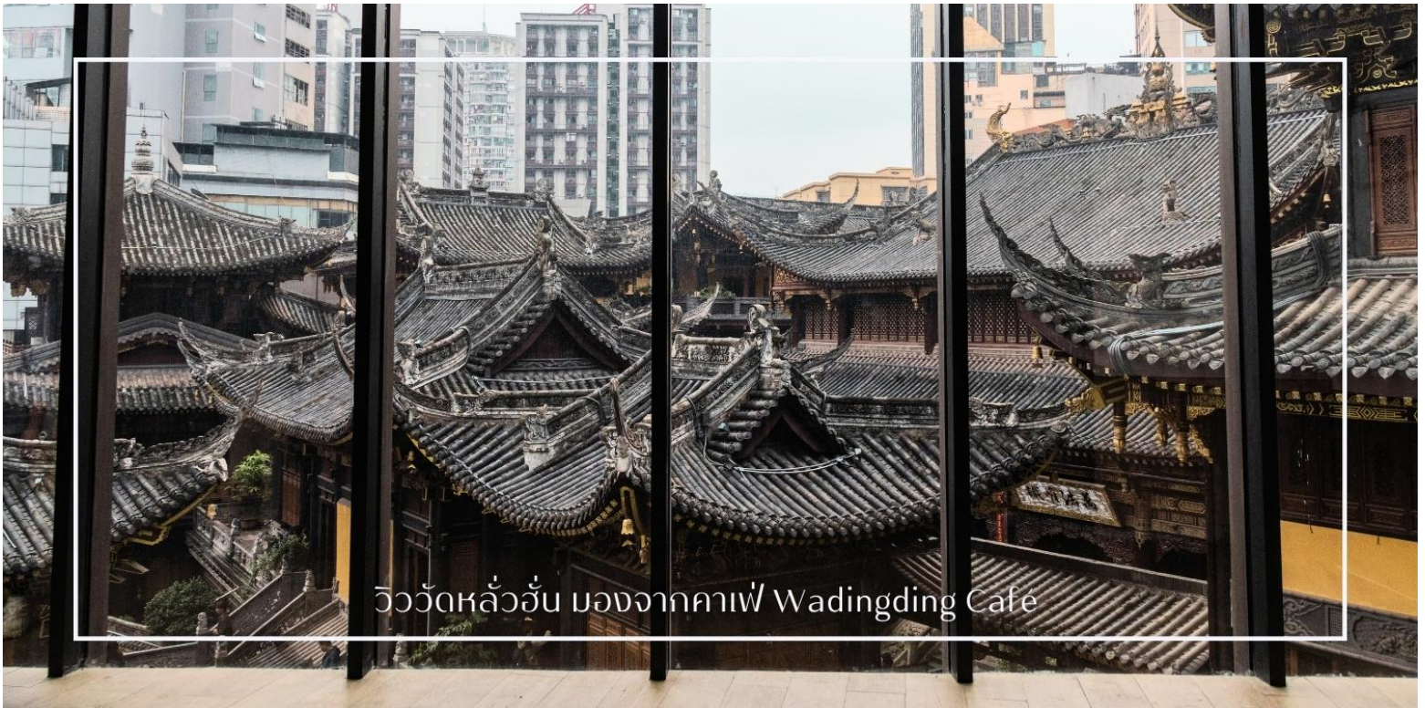
วิววัดหลัวอัน มองจากคาเฟ่ Wadingding Cafe

นำท่านสู่นำท่านเดินทางสู่ คาเฟ่ Wa Ding Ding Cafe สัมผัสประสบการณ์จิบกาแฟในบรรยากาศที่ผสมผสานระหว่างโลกอนาคต และอดีต อย่างลงตัว บนชั้นดาดฟ้าตึก S95 ย่านเจียฟางเปย ไฮไลท์คือการชมวิว "วัดหลัวอัน"วัดเก่าแก่พันปีผ่านกรอบกระจกบานใหญ่ ที่ได้รับการขนานนามว่าเป็นหนึ่งในจุดถ่ายรูปที่สวยงามที่สุดของมหานครฉงชิ่ง ให้ท่านได้เก็บภาพความประทับใจของหลังคาวัดสีทองอร่ามที่ตัดกับตึกสูงระฟ้าใจกลางเมือง พร้อมดื่มด่ำกับเครื่องดื่มที่รังสรรค์มาอย่างพิถีพิถัน