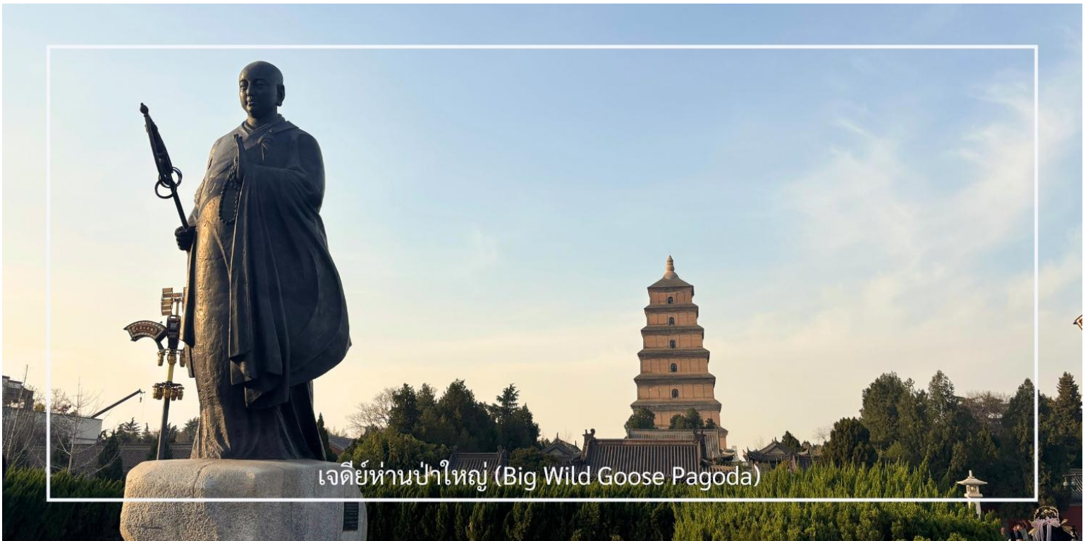
เจดีย์ห่านป่าใหญ่ (Big Wild Goose Pagoda)

นำท่านเดินทางสู่ เจดีย์ห่านป่าใหญ่ (Big Wild Goose Pagoda) ซึ่งตั้งอยู่ภายในบริเวณ วัดต้าซือเอิน (Da Ci'en Temple) สถานที่สำคัญทางพุทธศาสนาและประวัติศาสตร์ของจีน สร้างขึ้นในปี ค.ศ. 652 สมัยราชวงศ์ถัง เพื่อเก็บรักษาพระไตรปิฎกและพระธรรมคัมภีร์ที่ พระถังซำจั๋ง อัญเชิญกลับจากชมพูทวีป เจดีย์มีลักษณะทรงสี่เหลี่ยมแบบขั้นบันได สร้างด้วยอิฐเผา สะท้อนศิลปะจีนที่ผสมผสานอิทธิพลจากอินเดีย เดิมสูง 5 ชั้น ต่อมาได้รับการบูรณะจนมีความสูง 7 ชั้น (ประมาณ 64 เมตร) เป็นแบบอย่างของสถาปัตยกรรมพุทธศิลป์ยุคราชวงศ์ถังที่เรียบง่ายแต่ทรงพลัง ปัจจุบันเจดีย์แห่งนี้ถือเป็นสัญลักษณ์ทางวัฒนธรรมของเมืองซีอานและสถานที่ท่องเที่ยวยอดนิยมที่ควรมาเยือน