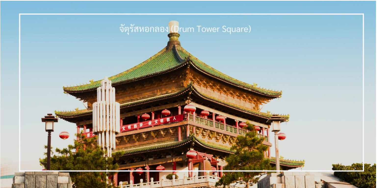
จัตุรัสหอกลอง (Drum Tower Square)

สมควรแก่เวลา นำท่านเดินทางสู่ สถานีรถไฟความเร็วสูงเมืองซีอาน เพื่อออกเดินทางสู่เมืองหยุนเฉิง (Yuncheng) โดย รถไฟความเร็วสูง ใช้ระยะเวลาเดินทางประมาณ 1.20 ชั่วโมง ระหว่างทางให้ท่านเพลิดเพลินกับทัศนียภาพสองข้างทาง ผ่านหน้าต่างของขบวนรถไฟที่ทันสมัย สะดวกสบาย และรวดเร็ว อีกหนึ่งประสบการณ์การเดินทางที่ทั้งผ่อนคลายและประทับใจ