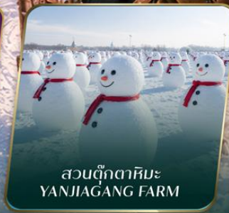
สวนตุ๊กตาหิมะ YANJIAGANG FARM