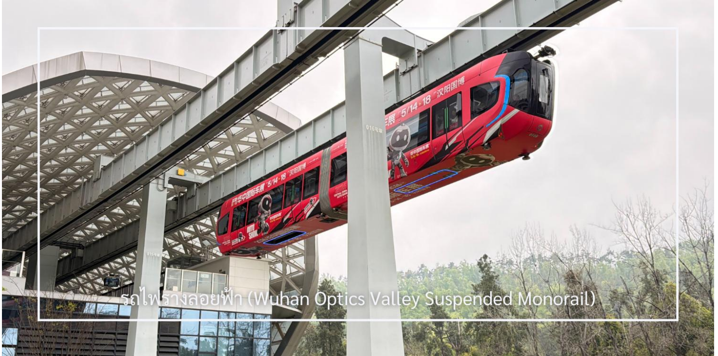
รถไฟรางลอยฟ้า (Wuhan Optics Valley Suspended Monorail)

นำท่านนั่ง รถไฟรางแขวนลอยฟ้า อีกหนึ่งประสบการณ์แปลกใหม่ของเมืองอู่ฮั่นภายในมีพื้นที่กระจก สามารถมองเห็นด้านล่างได้ชัดเจน ให้ความรู้สึกเหมือนลอยอยู่เหนือเมือง เพิ่มความตื่นเต้นตลอดเส้นทางระหว่างทางสามารถชมวิวสองข้างทางในมุมที่แตกต่าง พร้อมเก็บภาพความประทับใจกับการเดินทางรูปแบบพิเศษที่ไม่เหมือนใคร