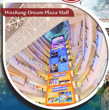
Wushang Dream Plaza Mall