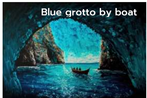
Blue grotto by boat