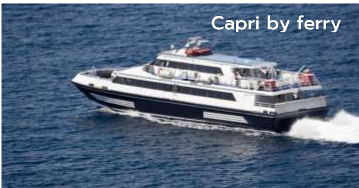
Capri by ferry