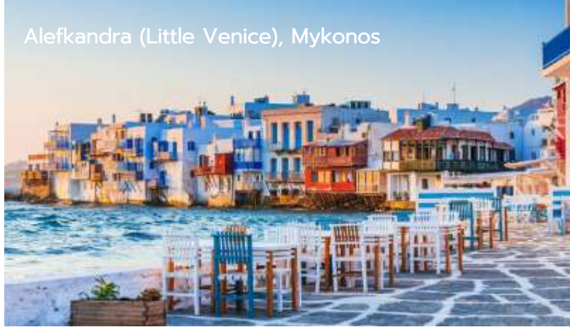
Alefkandra (Little Venice), Mykonos

นำท่านสู่ ลิตเติลเวนิส Little Venice ย่านที่สร้างขึ้นในศตวรรษที่ 18 ที่มีคฤหาสน์ของอดีต กับต้นเรือสีสดใสและร้านอาหารริมทะเลที่ดูเหมือนจะพุ่งขึ้นมาจากทะเลโดยตรง นอกจากนี้ยัง อยู่ติดกับกังหันลมบนเนินเขาอันโด่งดังของเกาะ ซึ่งเหมาะแก่การถ่ายภาพเป็นอย่างยิ่ง อีสระให้ ท่านเดินเล่นพักผ่อนตามอัธยาศัย