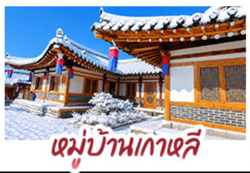
หมู่บ้านเกาหลี