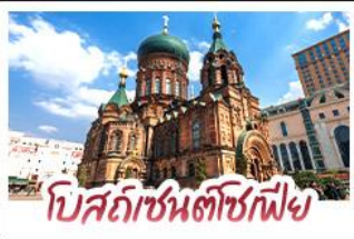
โบสถ์ซันตีซฟี