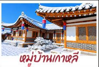
หมู่บ้านเกาเจี