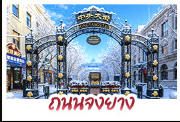
ถนนจงชาง