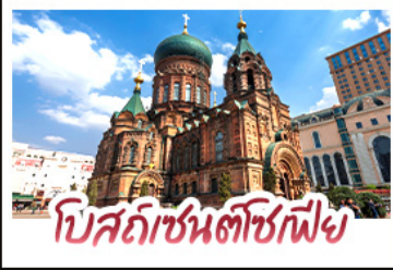
โบสถ์ซันติซอ์ฟี่

ไฮไลท์ เที่ยวฮาร์บิน เมืองแห่งน้ำแข็ง สมญานามมอสโกแห่งตะวันออก • แวะร้านเครื่องกันหนาวเตรียมความพร้อมก่อนปะทะความหนาวแบบติดลบ • ถ่ายรูปกับแลนด์มาร์คสุดน่ารัก ตึกดาหิมะยักษ์ที่สูงถึง 19 เมตร • ชมนิทรรศการแกะสลักหิมะสุดตระการตา ณ เกาะพระอาทิตย์ สบทุกไปกับกิจกรรมเทศกาลแกะสลักน้ำแข็ง HARBIN ICE AND SNOW FESTIVAL