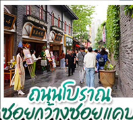
ถนนโบราณ ชอยกว้างชอยแคม