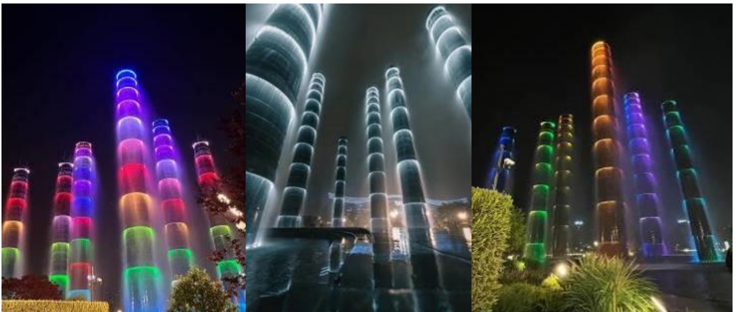
นำท่านชม พวน้ำพุไม้ไฟตึกSKP แสงสียามค่ำคืนที่ ลานห้างสรรพสินค้า SKP แลนด์มาร์คแห่งใหม่

2UTFU-MU003 เฉิงตู...ตะลุย3อุทยาน อุทยานปืเผิงโกว อุทยานต้ากู่ปิงชวน อุทยานสี่ตรุณี *ไม่ลงร้านช้อปปิ้ง* 6วัน 5คืน โดยสายการบิน China Eastern Airlines (MU)