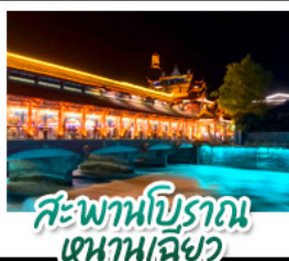
สะพานโบราณ หนานเฉียว