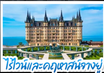
ไรไวน์และคฤหาสน์นางอยู่