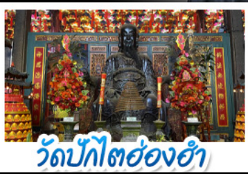
วัดปักไต้ฮ่องกง