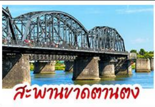
สะพานหวาดถานตง

2 มหัศจรรย์ธรรมชาติระดับโลก "หาดแดงผานจิน" คู่กับ "ถ้ำน้ำเป็นสี" ยืนมองฝั่งเกาหลีเหนือที่ตามอง • ชมความยิ่งใหญ่ของพระราชวังเส้นหยางกู่กิง