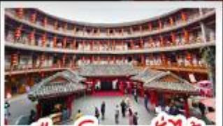
เมืองโบราณลั่วใต้