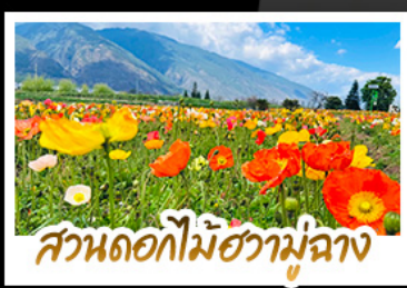
สวนดอกไม้ฮามู่ฉาง