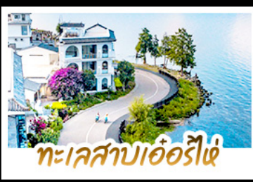
ทะเลสาบเอ๋อร์ไฮ่