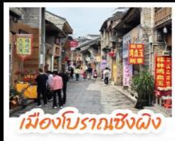
เมืองโบราณเซียงผิง

เช็คอินจุดไฮไลท์กุ้ยหลิน เจดีย์เงินเจดีย์ทอง ภูเขาหวงซ่าง นั่งเคเบิลคาร์สู่ ภูเขาหลิว จุดชมวิวกะลาภูเขา แห่งเมืองหยางซั่ว ล่องเรือแม่น้ำลิวเจียง ตามรอยช้างหลังภาพรมบัตร 20 หยวน อีสรະซ้อปึงถนนคนเดิน 2 แห่ง ถนนดงซีเซียง ถนนซีเจีย นั่งกระเช้าบอลูนชมวิวแบบ 360 องศา