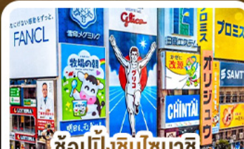
ช้อปปิ้งชินโซบาชิ และโดตงโมริ