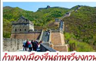
กำแพงเมืองจีนด้านจวิ้นกวน

UNIVERSAL STUDIO BEIJING DISNEYLAND SHANGHAI รถไฟความเร็วสูง - ถ่ายรูปห่อไข่มุก กำแพงเมืองจีนด้านจวิ้นกวน บ๊วยพิเศษ เปิดปักกิ่ง, สุกี่หม้อไฟ BUFFET