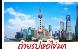
ถ่ายรูปไข่มุก