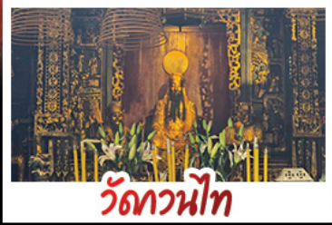
วัดกวนโถง