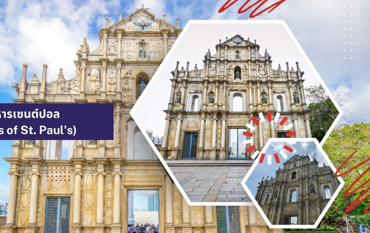
วิหารเซนต์ปอล (Ruins of St. Paul's)

นำท่านเดินทางสู่ นำท่านเดินทางสู่ มาเก๊า (ในการเดินทางข้ามด่าน ท่านจะต้องลากกระเป๋าสัมภาระของท่านเอง และผ่านพิธีการตรวจคนเข้าเมืองใช้เวลาในการเดินประมาณ 45-60 นาที) ในอดีตมาเก๊าเป็นเพียงแค่มุมบ้านเกษตรกรรมและประมงเล็กๆ ซึ่งเป็นเมืองที่มีประวัติศาสตร์ยาวนาน โดยมีชาวจีนกวางตุ้งและฟูเจี้ยนเป็นชนชาติดั้งเดิม จนมาถึงช่วงต้นศตวรรษที่ 16 ชาวโปรตุเกสได้เดินเรือเข้ามายังคาบสมุทรแถบนี้เพื่อติดต่อค้าขายกับชาวจีนและมาสร้างอาณานิคมอยู่ในแถบนี้ ที่สำคัญคือ ชาวโปรตุเกสได้นำพาเอาความเจริญรุ่งเรืองทางด้านสถาปัตยกรรมและศิลปวัฒนธรรมของชาติตะวันตกเข้ามาอย่างมากมาย ทำให้มาเก๊ากลายเป็นเมืองที่มีการผสมผสานระหว่างวัฒนธรรมตะวันออกและตะวันตกอย่างลงตัว