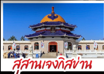
สุสานเจกิสซ่าน