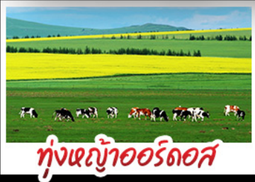
ทุ่งหญ้าเออร์ดอส

ทุ่งหญ้าเออร์ดอส สุสานเจกิสซ่าน แกรนด์แคนยอนแม่น้ำเหลือง