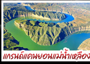
แกรนด์แคนยอนแม่น้ำเหลือง