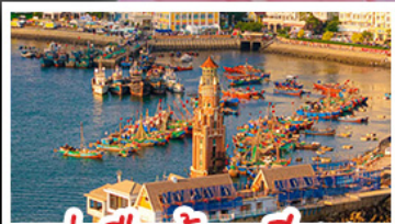
ท่าเรือตาหลายน