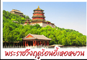
พระราชวังฤดูร้อนอี่เหอหยวน

กำแพงเมืองจีนด่านจวิ้งกวน - พระราชวังฤดูร้อนอี่เหอหยวน สวนจิ่งอัน - วัดลามะ - ไม่หลงร้านช้อปปิ้ง - โรงแรม 4 ดาว มือพิเศษ เปิดปีกกิ้ง สุกิมองโกล MICHELIN GUIDE ร้าน TAO TAO JU