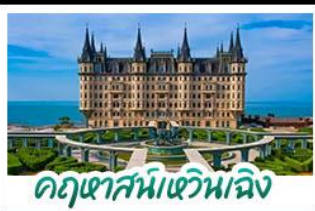
อุทยานสาขาน้ำจืด

เมืองท่าชิงเต่า - ฤดูหิมะหวิบเจิง เบียร์ชิงเต่า + อาหารทะเล สตรีทอาร์ต สตูดิโอจิบลิ