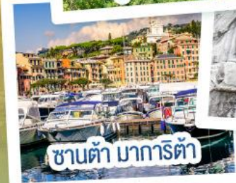
ซานต้า มารีตา