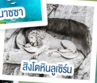
สิงโตหินลูเซิร์น