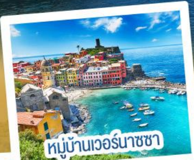
หมู่บ้านเวอร์นาซซา