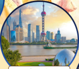
นอร์ทบัน กรีนแลนด์