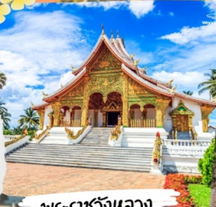
พระราชวังหลวง