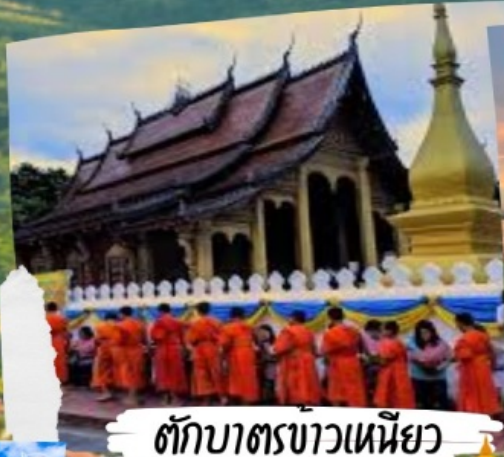
ตักบาตรข้าวเหนียว

ค่าธรรมเนียมตั๋วเครื่องบินท่านละ 5,000 บาท เดินทางได้ทุกวันยกเว้นวันที่ 25/12 - 5/1 ของทุกปี