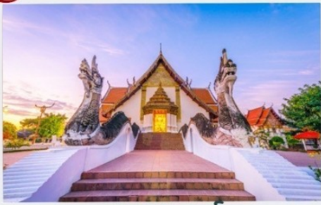
วัดภูมินทร์