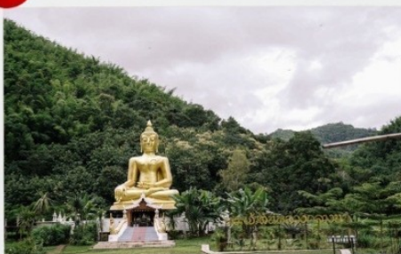
วัดนาคูหา