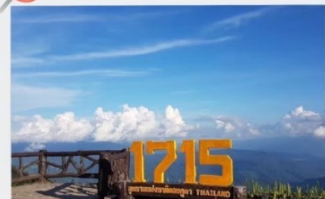
จุดชมวิวที่มีความสูง 1715