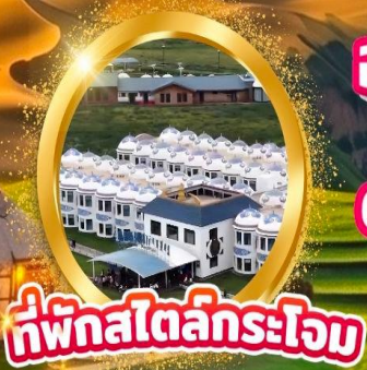
ที่พักสไตล์กระโจม