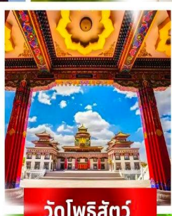
วัดโพธิ์สัตว์