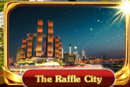
The Raffle City