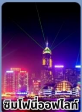
ชมไฟนีออนไฟรี่

ราคาเที่ยวเที่ยวเกินคุ้ม 12,999 บาท/ท่าน