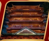
Dafo Buddhist temple