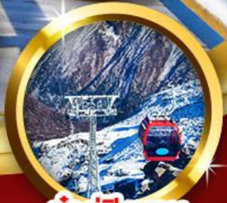
ต่ากู่ปิงชวณ