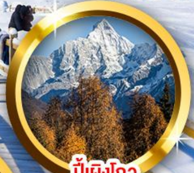
ปี้เิงโกว