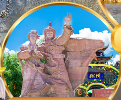
เมืองโบราณขงฟาน