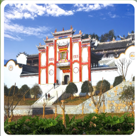
บ้านเกิดชวีหยวน