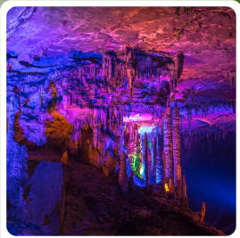
ถ้ำเก้าเทพ