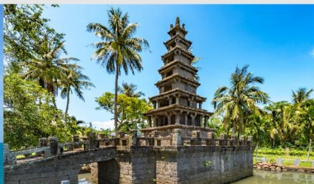
เจดีย์ 2 ชั้นนั่งเหม่ยหลาน