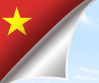
Color of Venice Show