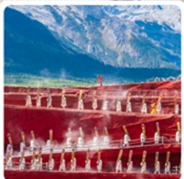
Impressions of Lijiang

ไฮไลท์ ที่ควรรู คุณหมิง ต้าหลี่ ลี่เจียง แชงกรี่ล่า นั่งกระเช้าขึ้นภูเขาฝิมะมิงกรยก ชมโชว์ "Impression of Lijiang"