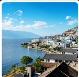
โคงตั่ว S ทะเลสาบเอ๋อร์ไห่