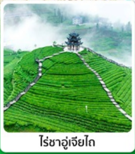
ไร่ชาอู๋เจียโก