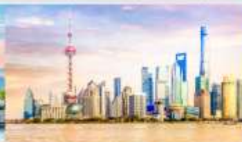
หาดไว่กาน