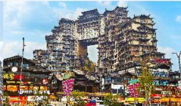
ตีทมห้ศจวสรร์ย 72