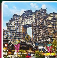
ตึกหัดจรรยา 72