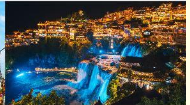
หมู่บ้านโบราณฟูหรงเจิน

*ทางบริษัทฯ ขอสงวนสิทธิ์ในการสลับโปรแกรมทัวร์ตามความเหมาะสมขึ้นอยู่กับสถานการณ์หน้างาน โดยคำนึงถึงผลประโยชน์ของลูกค้าเป็นสำคัญ