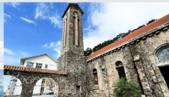
โบสถ์หินตามด้าว