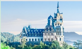
ปราสาทตามด้าว