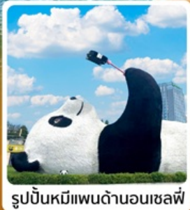
รูปปั้นหมีแพนด้าอนเซลฟ์